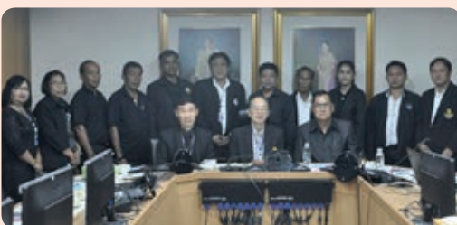
สหกรณ์การเกษตรเมืองอุทัยธานี จำกัด