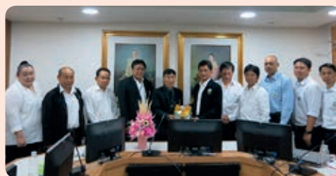
สหกรณ์ออมทรัพย์พนักงานมูลนิธิโครงการหลวง จำกัด