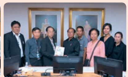
สหกรณ์การเกษตรไพนสวรรค์ จำกัด