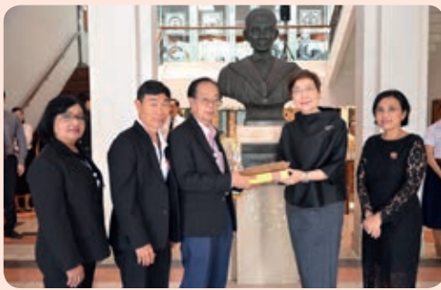
คณะสถาปัตยกรรมศาสตร์