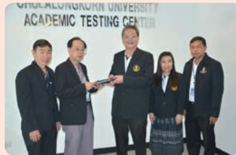
ศูนย์ทดสอบทางวิชาการ