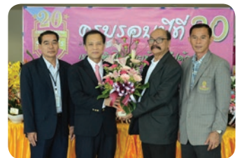
ครบรอบ 20 ปี ศูนย์กีฬาแห่งจุฬาฯ