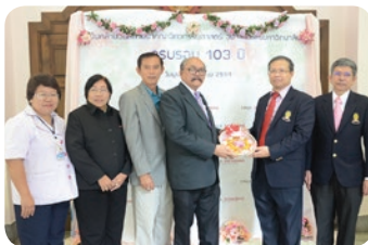
ครบรอบ 103 ปี คณะวิศวกรรมศาสตร์