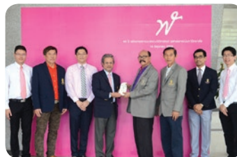
ครบรอบ 44 ปี คณะนิติศาสตร์