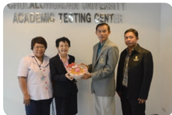
ครบรอบ 20 ปี ศูนย์ทดสอบทางวิชาการ