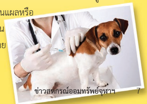
ชาวสทกรณ้อมทรัพย์จุฬา