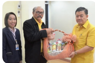
ดร.วิณะโรจน์ ทรัพย์ส่งสุข อธิบดีกรมส่งเสริมสหกรณ์