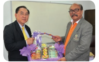
ศ.ดร.ธราพงษ์ วิฑิตสานต์ รองอธิการบดี