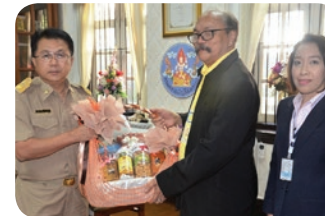
นายสมปอง อินทร์ทอง อธิบดีกรมตรวจบัญชีสหกรณ์