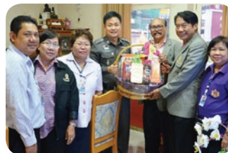
พ.ต.อ.จารุต ศรุตยาพร ผู้กำกับ สน.ปทุมวัน