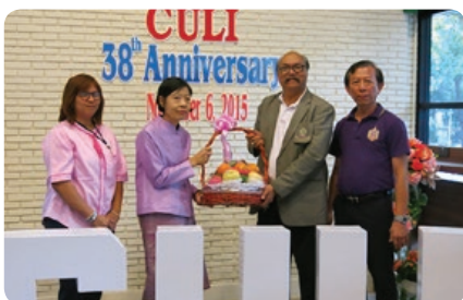
สถาบันภาษา