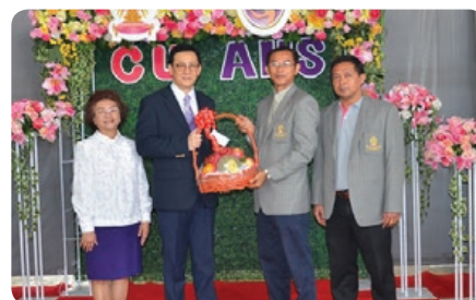
คณะสหเวชศาสตร์