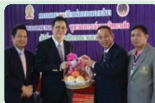
ครบรอบ 23 ปี คณะสหเวชศาสตร์