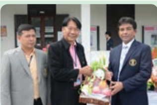
ครบรอบ 16 ปี คณะวิทยาศาสตร์การกีฬา