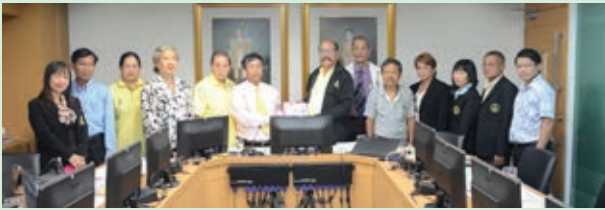
สหกรณ์ออมทรัพย์และการธณกิจมหาวิทยาลัยรามคำแหง จำกัด