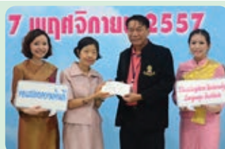
ครบรอบ 37 ปี สถาบันภาษา