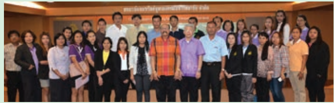
สหกรณ์จังหวัดสมุทรปราการ