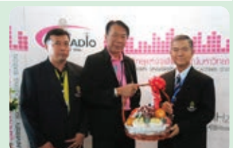
ครบรอบ 49 ปี สถาบันวิทยุแห่งจุฬาฯ