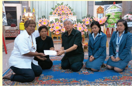
พ.จ.อ.พูน อางปรุ