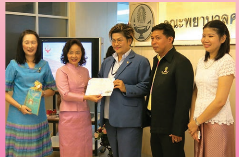
ครบรอบ 25 ปี พยาบาลศาสตร์