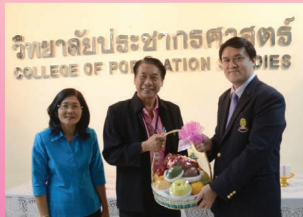
ครบรอบ 47 ปี วิทยาลัยประชากรศาสตร์