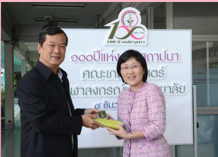
ครบรอบ 100 ปี คณะเภสัชศาสตร์