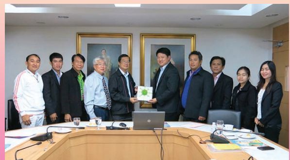
สหกรณ์ออมทรัพย์มหาวิทยาลัยมหาสารคาม จำกัด