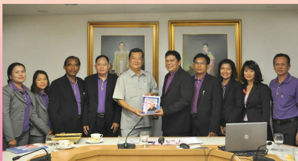
สหกรณ์ออมทรัพย์สาธารณสุขสงขลา จำกัด